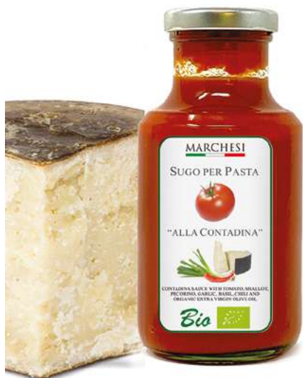
CONTADINA cod. SUGCONT

pomodori Bio, olio extra vergine di oliva Bio, pecorino Bio 5,7%, scalogno Bio 3,3, sale, aglio Bio, basilico Bio, peperoncino Bio