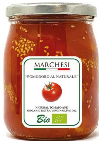
POMODORO AL NATURALE 500 g – cod. POM05

Sughi per pasta bio Sauce for pasta organic 260 gr