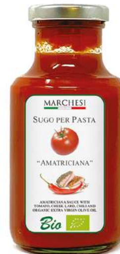
AMATRICIANA cod. SUGAMA

pomodoro Bio 76%, melanzane Bio 15%, olio extra vergine di oliva Bio, sale, aglio Bio, basilico Bio