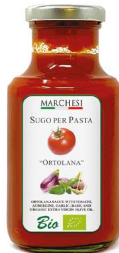
ORTOLANA cod. SUGORT

pomodori Bio, olio extra vergine di oliva Bio, pecorino Bio 5,7%, scalogno Bio 3,3, sale, aglio Bio, basilico Bio, peperoncino Bio