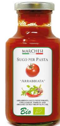
ARRABBIATA cod. SUGARR

pomodoro Bio 76%, guanciale Bio 13%, olio extra vergine di oliva Bio, vino bianco Bio, peperoncino Bio, sale.