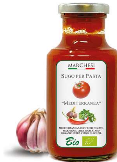
MEDITERRANEA cod. SUGMED

pomodoro Bio 85%, olio extra vergine di oliva Bio, sale, peperoncino Bio, aglio Bio, maggiorana Bio 0,3%